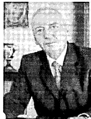
Il commissario Attilio Visconti

chieri, indicando come «necessari» gli investimenti negli impianti di trattamento «per ridurre i livelli di inquinamento individuati». Di certo - afferma Visconti - la risposta di Bruxelles, oltre all'assenza di riferimenti al principio di prossimità nelle direttive comunitarie, rimarca la necessità di intervenire per migliorare la qualità delle acque del Garda e del Chiese, in linea con gli obiettivi fissati dal ministero dell'Ambiente del 2020, al termine del Tavolo tecnico che ha valutato la compatibilità del fiume a ricevere lo scarico degli impianti di depurazione». L'incontro con Cingolani punta «alla condivisione dello spirito e dei contenuti della pronuncia europea», afferma Visconti, ma servirà anche a sollecitare risorse, con «la conferma della disponibilità del Mite a finanziare, anche alla luce delle opportunità offerte dal Pnrr, interventi di mitigazione e di superamento delle criticità ambientali del Chiese». Quanto ai Comuni gardesani, il prefetto-commissario intende localizzare l'incontro sulle compensazioni economiche previste nella convenzione attuativa dell'Accordo di programma siglato tra ministro dell'Ambiente, Regione Lombardia e Regione Veneto. In quel documento si parla di «impegno a desti-